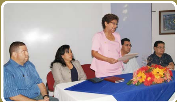
Clausura. Docentes de Ciencias y Humanidades participaron en el cierre de la capacitación académica.

Los organizadores son conscientes que esos cambios no serán posibles si la universidad entera no tiene el pleno consenso de la necesidad de cambios profundos.