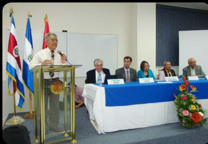
Clausura. Autoridades de la UES felicitaron el logro alcanzado a docentes de las Humanidades.

La maestría fue sustentada en tres acciones: conocimiento de las teorías psicopedagógicas que sustentan el proceso de enseñanza- aprendizaje, la forma en que el niño va construyendo el conocimiento en las edades pre escolares y escolar y el conocimiento de la ciencia y tecnología en la sociedad.