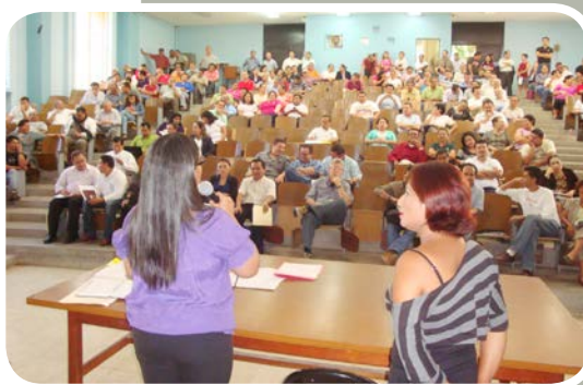
Elección. Docentes y Administrativos de Humanidades participaron en elección propietarios y suplentes del FUP.