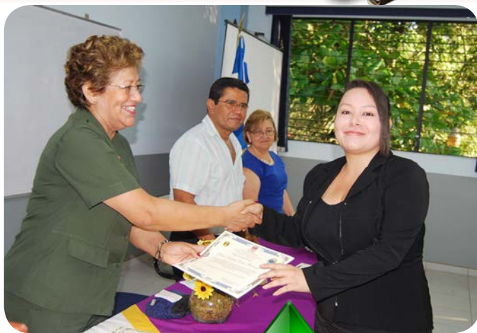
Entrega. Autoridades de la Facultad de Ciencias y Humanidades entregan diplomas de reconocimientos a estudiantes de Trabajo Social que culminaron Proceso de Grado.