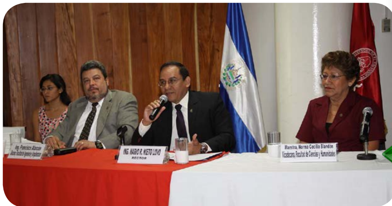
Presentación. Autoridades de la Universidad de El Salvador informan sobre los programas de becas que oferta ERASMUS MUNDUS.

Agregó que ésto permite contribuir al desarrollo de los recursos humanos y la capacidad de cooperación internacional de las instituciones de educación superior mediante el aumento de la movilidad entre la UE y otros países.