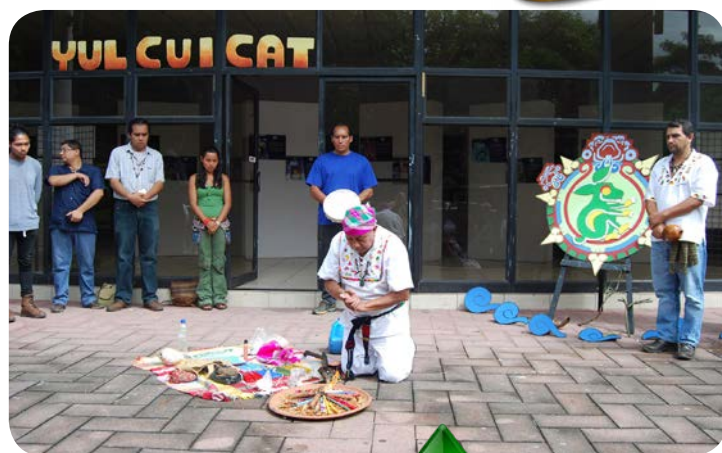
Ceremonia indígena. Representantes de la comunidad indígena salvadoreña realizan un ritual inaugural para el festival cultural.