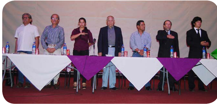
Remembranza. Líderes estudiantiles de los 70s y 80s recordaron el trabajo organizativo realizado al interior de la Universidad de El Salvador.