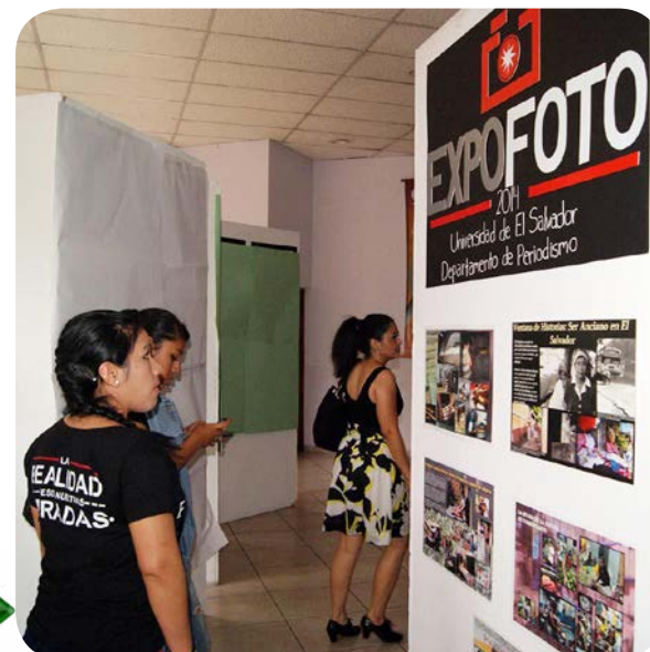
Muestras. Asistentes a la Expo de Foto observan el trabajo fotográfico realizado por estudiantes de Periodismo.

La actividad se realizó el día 26 de mayo en el Cineteatro de la Universidad de El Salvador.