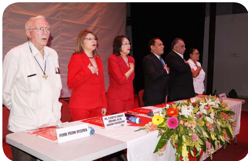
Mesa de Honor. Autoridades de la UES e invitados especiales participaron en actos para recordar la vida y obra de Monseñor Romero.

En el evento se presentó un Documental de Monseñor Romero producido por la Secretaría de Comunicaciones de la Universidad de El Salvador, también se desarrollaron actividades culturales en poesía, teatro y danza.