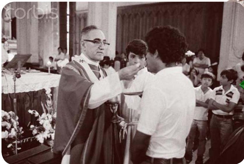
Comunión. Momento en que un feligrés recibe la hostia.

Su desarrollo irá difundiendo el pensamiento universitario, político, social, cultural y económico que tiene lugar en nuestro país. Las 12 facultades participarán en la