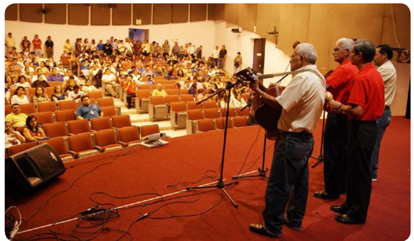
Música. Trabajadores de la UES animaron el acto conmemorativo organizado por las autoridades universitarias.

La actividad fue organizada por Rectoría y Vicerrectoría