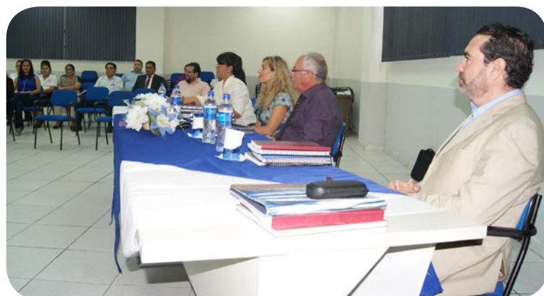
Jurado Calificador. Profesionales de la Universidad de Granada, España, participan en la exposición de resultados de la primera fase del Doctorado en Innovación Educativa.